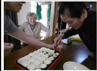
鈴カステラを焼きました