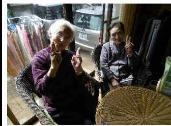
日の当たる縁側で団らん