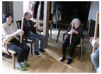
棒を使った全身運動です