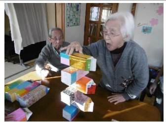
ドデカジェンガに挑戦中