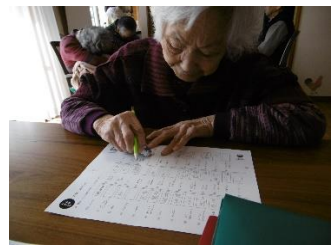
漢字の脳トレです