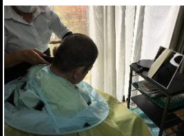
坊主にしてくれ！と5分削りにされました。