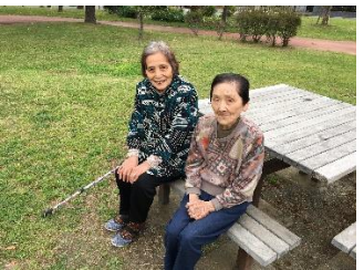
公園へお散歩です