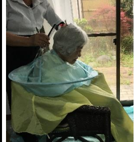
美容師さんと談笑を楽しみながら。

二か月半に一度の定期イベントの訪問理容Dayです。今回は七名の訪問理容Dayです。今回は七名の訪問理容Dayです。今回は七名の訪問理容Dayです。