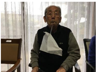
ストローティッシュすくい