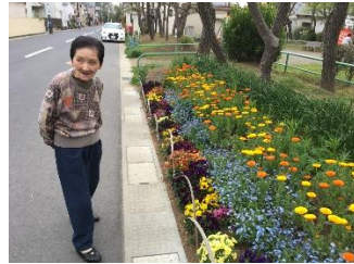
花々を眺めにつこり。