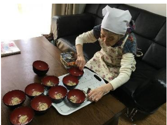
手際よく手伝って下さいました