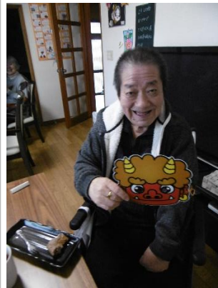
中身はあんこと黒糖をご用意しました。