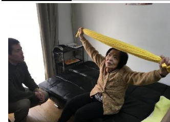
機能訓練に参加中です

今年のバレンタインはあんこ入りの手作り饅頭をつくりました。ポリウム満点でしたが皆様、沢山召し上がられました。