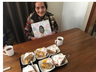
お誕生日をお祝いしました