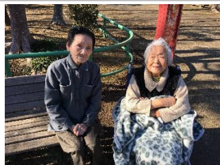
近隣の公園へお散歩です