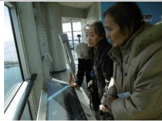
千葉ポートタワーへ