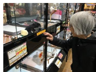
ペットショップにて