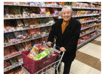
スーパーへお買い物に♪